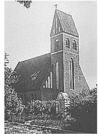
Kirche in Trappen 1944