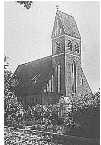
Kirche in Trappen 1944