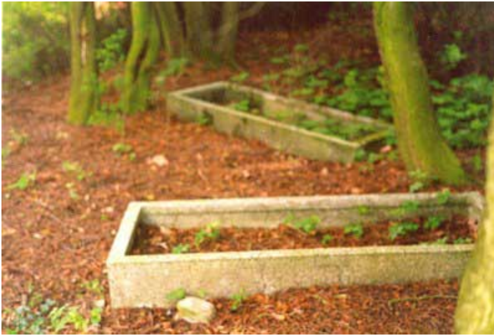
Bild oben: Grabeinfassungen unserer Familienmitglieder, die kreuz und quer herumlagen (1995), auf den Stelen waren alle Inschriften ausgewaschen. Aber: Alle Sträucher und Pflanzen, die für einen Friedhof typisch sind, waren da: Das wunderschön blau blühende Immergrün, Lebensbäume in prächtiger Größe und Trauerweidengewächs.