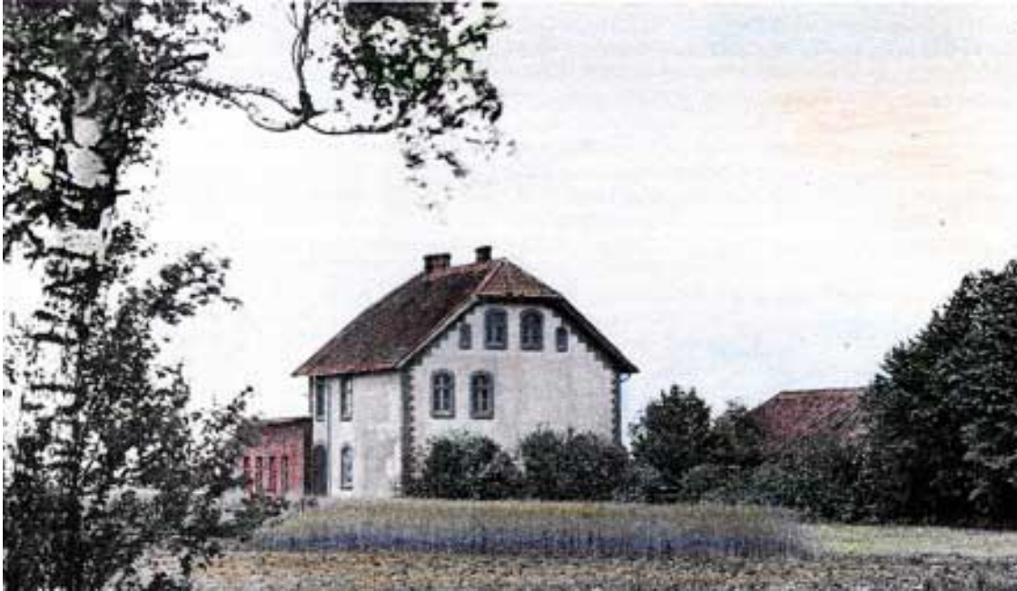
Bild links: Die Schule in Schwarzfelde (Groß Jodupönen), die Schule meiner Mutter

Wir tuckerten dann auf diesem Monstrum von Gefährt über das große Feld, mit der breiten Egge eine riesige Staubwolke hinter uns herziehend. Der Tartar zeigt nach rechts und sagt: "Bolschoi.....", das Wort für Friedhof, nehme ich an. Ich verneine. Ich weiß, dass es in der Nähe noch einen größeren Friedhof gibt. Ein Stückchen weiter zeigt er auf einen einzelnen, in der Landschaft stehenden Baum und sagt: "Skola". Die Schule meiner Mutter, meiner Familie. Ich besuchte sie 1944 nur wenige Wochen, habe kaum Erinnerungen daran. Es ist schon ein seltsames Gefühl zu wissen: Hier stand einmal eine Backstein-Schule, zu der die Marjellens und Lorbasse von weither gelaufen kamen. --- Wegen dieses langen Schulweges wurde ich auch im Dorf bei der Großmutter väterlicherseits eingeschult. Die Schule war nur drei Häuser von unserem Haus entfernt. Diese Schule fand ich gut erhalten wieder. In ihr ist ein Heimatmuseum und eine Bücherei untergebracht.